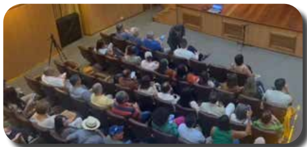
O primeiro Tour Oficial da Prife In-

ternational abrangeu cinco cidades de diferentes regiões: Natal(RN), Belo Horizonte( MG), Campo Grande(MS), São Paulo(SP) e Foz do Iguaçu(PR).